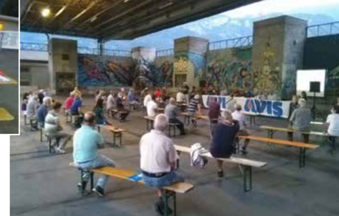
Assemblea in piazza "Falcone e Borsellino"