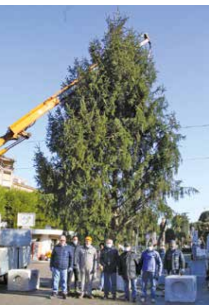
Posizionamento albero a Civitanova Marche