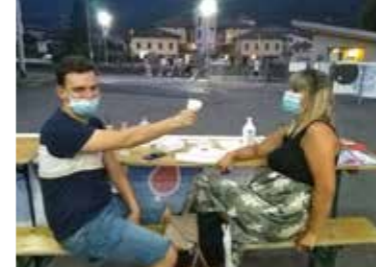
Avisini al controllo temperatura

Anche quest'anno è stata inviata ai diciottenni di Esine, Berzo Inferiore e Piancogno, unitamente all'AIDO, una lettera di invito ad interessarsi dell'Avis ed eventualmente a fare quel salto di qualità che è la donazione di sangue, fonte di vita e speranza per i tanti ammalati e