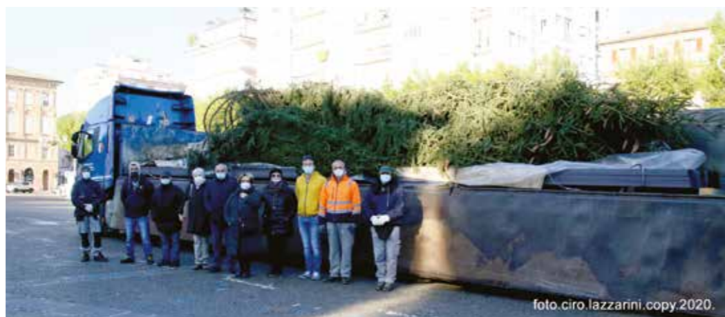
Consiglieri Avis e lavoratori del Comune di Civitanova Marche