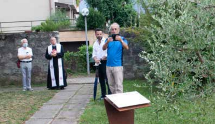
Videochiamata con "i gemelli" di Civitanova Marche