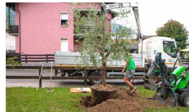
Posa ulivo al parco "Donatori di Sangue"

Purtroppo un'altra significativa iniziativa so-