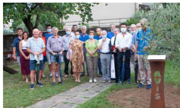
I partecipanti alla cerimonia

È slittata anche la festa della ricorrenza per i 50 anni di fondazione della nostra sezione Avis Comunale di Esine , inizialmente prevista per il 5-6 Marzo, poi spostata a Settembre e adesso riman-