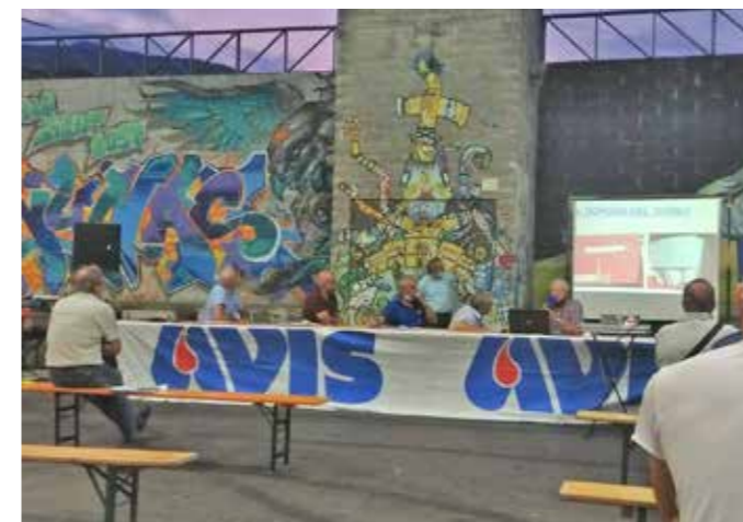
Presentazione dell'elaborato degli Alunni delle Scuole per il Concorso AVIS, AIDO, ADMO